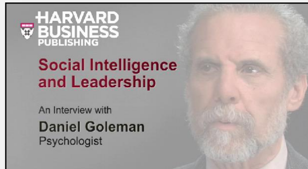
▲ 美國《時代》雜誌專欄作家 - 丹尼爾·高曼