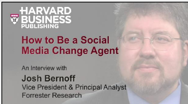
◀ 『網客聖經』作者 – 喬許·柏諾夫